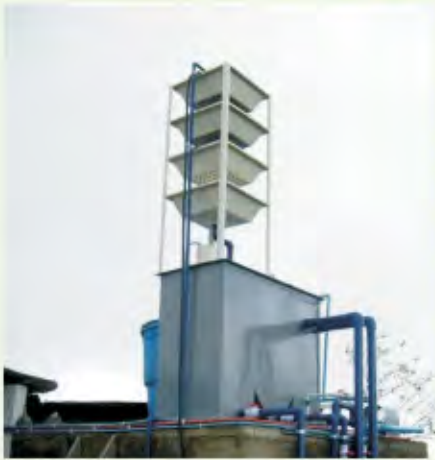
PLANTAS DE PRODUCCION DE AGUA POTABLE

SOMOS UNA EMPRESA ESPECIALIZADA EN SOLUCIONES DE TRATAMIENTO DE AGUAS