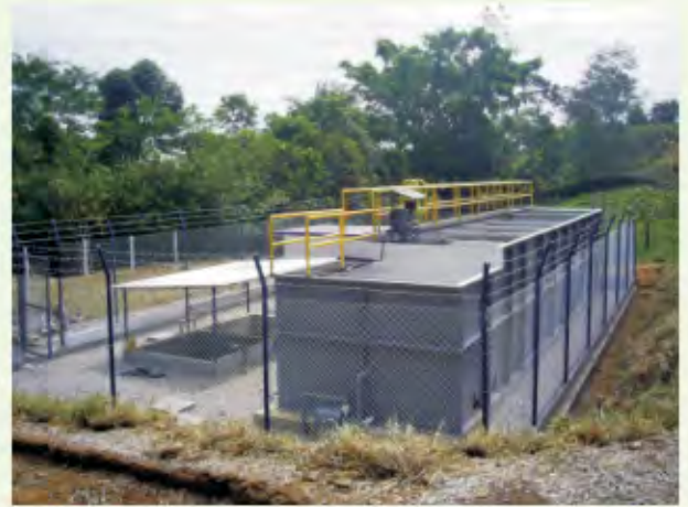
PLANTAS DE TRATAMIENTO DE AGUA RESIDUAL DOMESTICA E INDUSTRIAL

DISEÑAMOS, CONSTRUIMOS Y OPERAMOS TODO TIPO DE PLANTAS DE TRATAMIENTO DE AGUAS